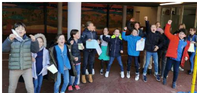
Les supporters donnent de la voix

A noter que le championnat Printemps 2020 débutera dès la rentrée, lundi 9 Mars ! Le calendrier, mis régulièrement à jour est toujours disponible au tableau du hall d'entrée !