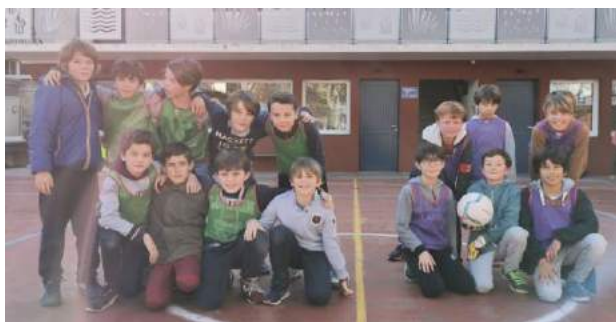
Les 2 équipes finalistes

Félicitations à eux et bravo aux CM1 Jaune pour leur magnifique parcours dans la compétition.