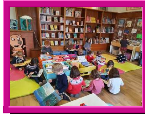
Sorties des MS rouge