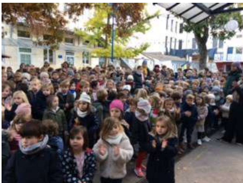
Chants devant la crèche