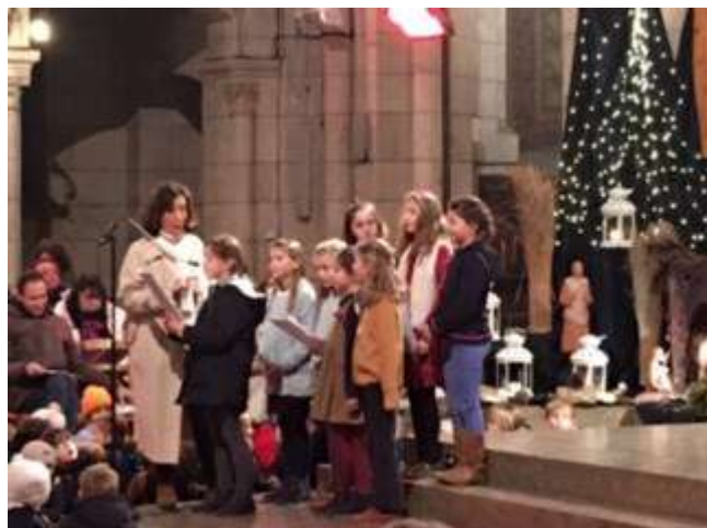
Nos petits chanteurs