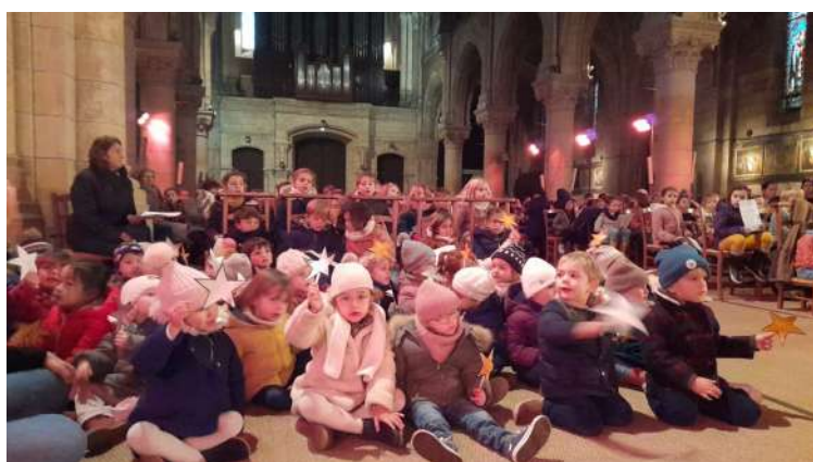
Les plus petits sont entrés avec les lumières, les étoiles et Brebis « pot de colle » tous accueillis par le Père Laurent