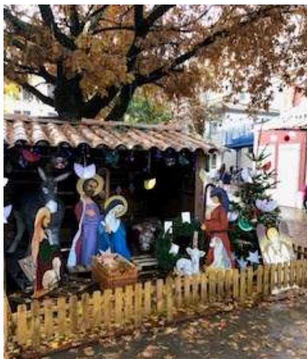
Notre jolie crèche