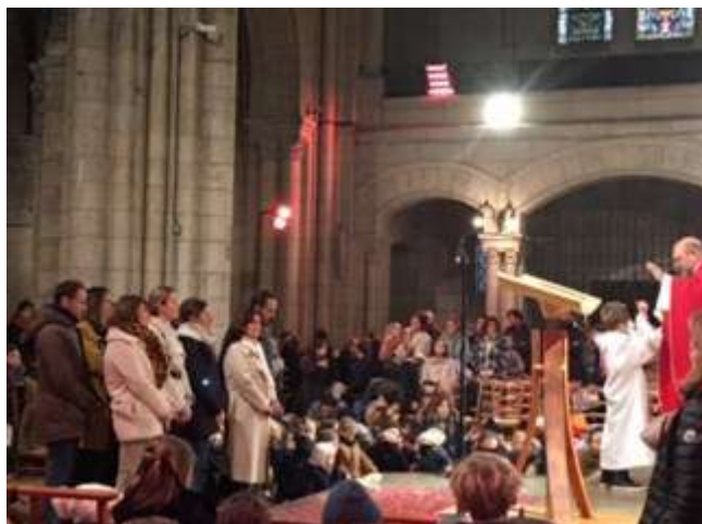
Bénédition des catéchistes